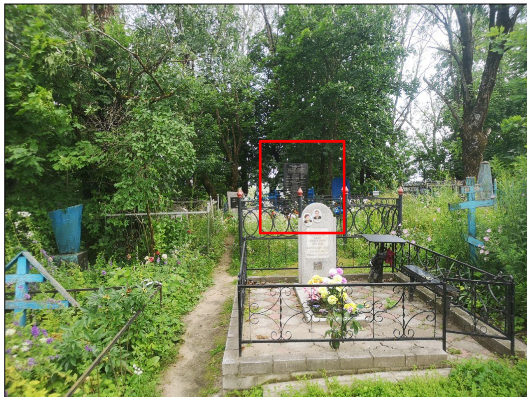
Видовая точка № 4. Вид на ОКН «Братская могила советских воинов, погибших в 1941 и 1943 гг. в боях с немецко-фашистскими захватчиками» с западной стороны.