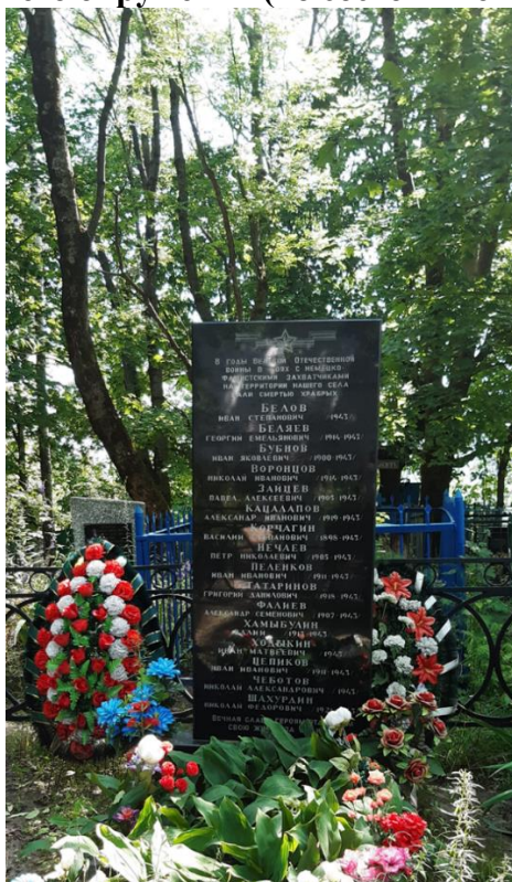
Видовая точка № 1. Вид на ОКН «Братская могила советских воинов, погибших в 1941 и 1943 гг. в боях с немецко-фашистскими захватчиками» с северной стороны с близкого расстояния.