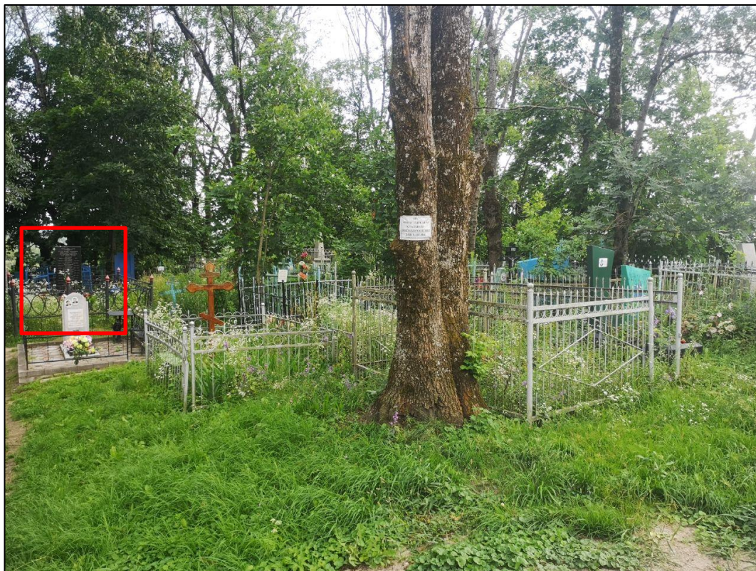
Видовая точка № 3. Вид на ОКН «Братская могила советских воинов, погибших в 1941 и 1943 гг. в боях с немецко-фашистскими захватчиками» с северной стороны.